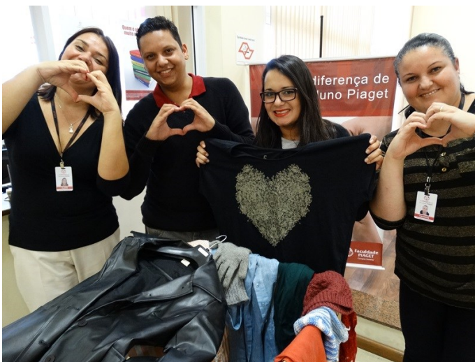
Campanha do Agasalho: ação solidária