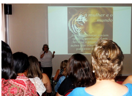
Dia Internacional da Mulher