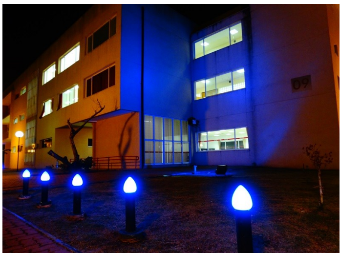
Novembro Azul: iluminação especial