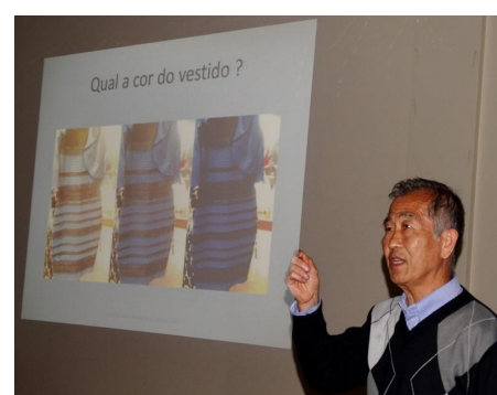
Ano Internacional da Luz