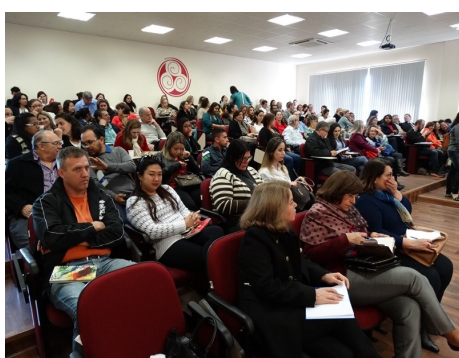
Seminário de Assistência Social