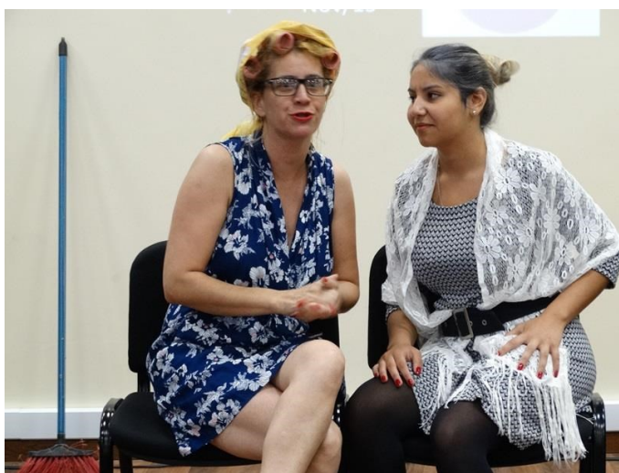
Apresentação de peça teatral de alunos de escola estadual