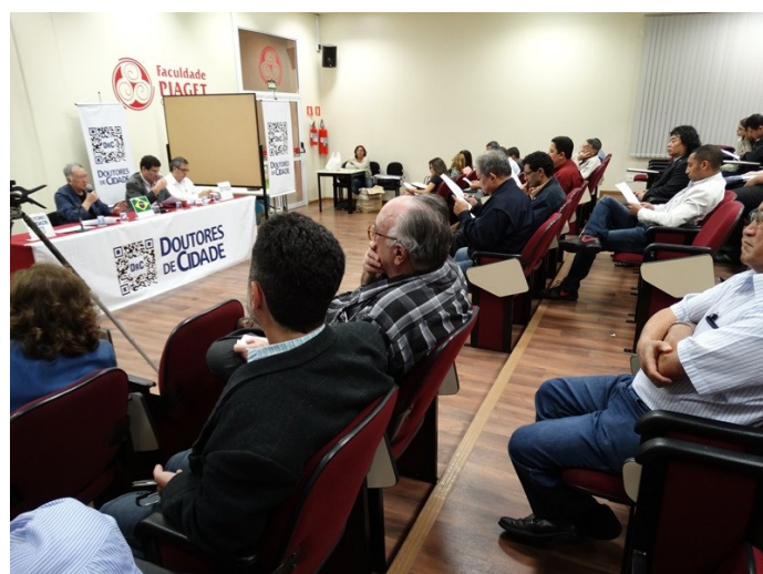
Curso Águas e Urbanismo e fundação de ONG