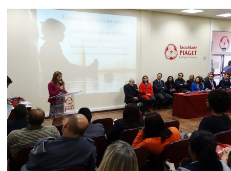
Combate à exploração infantil