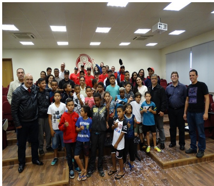
Parceria com entidade que atende crianças da comunidade

A Faculdade Piaget sediou e ofereceu, em seu campus, diversas atividades de cunho cultural, social ou científico no decorrer de 2015, tais como congressos, feiras, palestras, sessões de cinema com debate, campanhas humanitárias (como a arrecadação de agasalhos para o Fundo Social de Solidariedade), lançamentos de livros, entre outros, sempre com entrada franca para seus alunos e toda a comunidade.