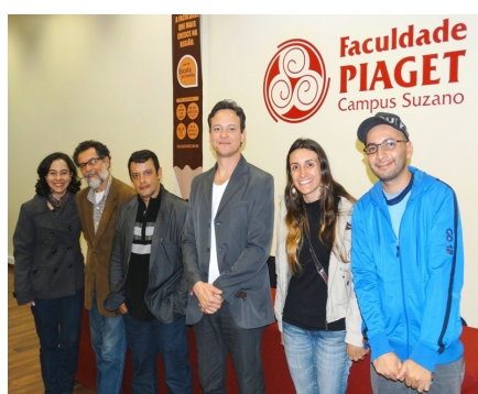
Cinema e debate no auditório