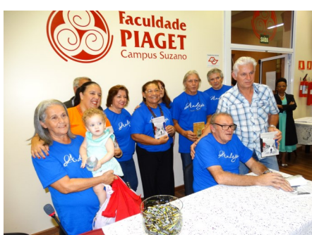
Lançamento de livro de poesias