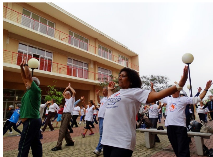
Dia do Desafio no campus: Alunos da Piaget e também a comunidade foram incentivados a praticar atividade física