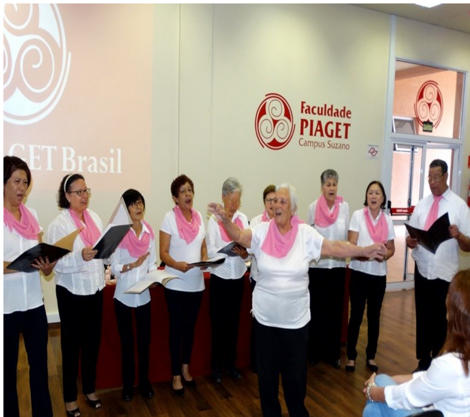
Outubro Rosa: programação deste ano teve apresentação de coral de entidade