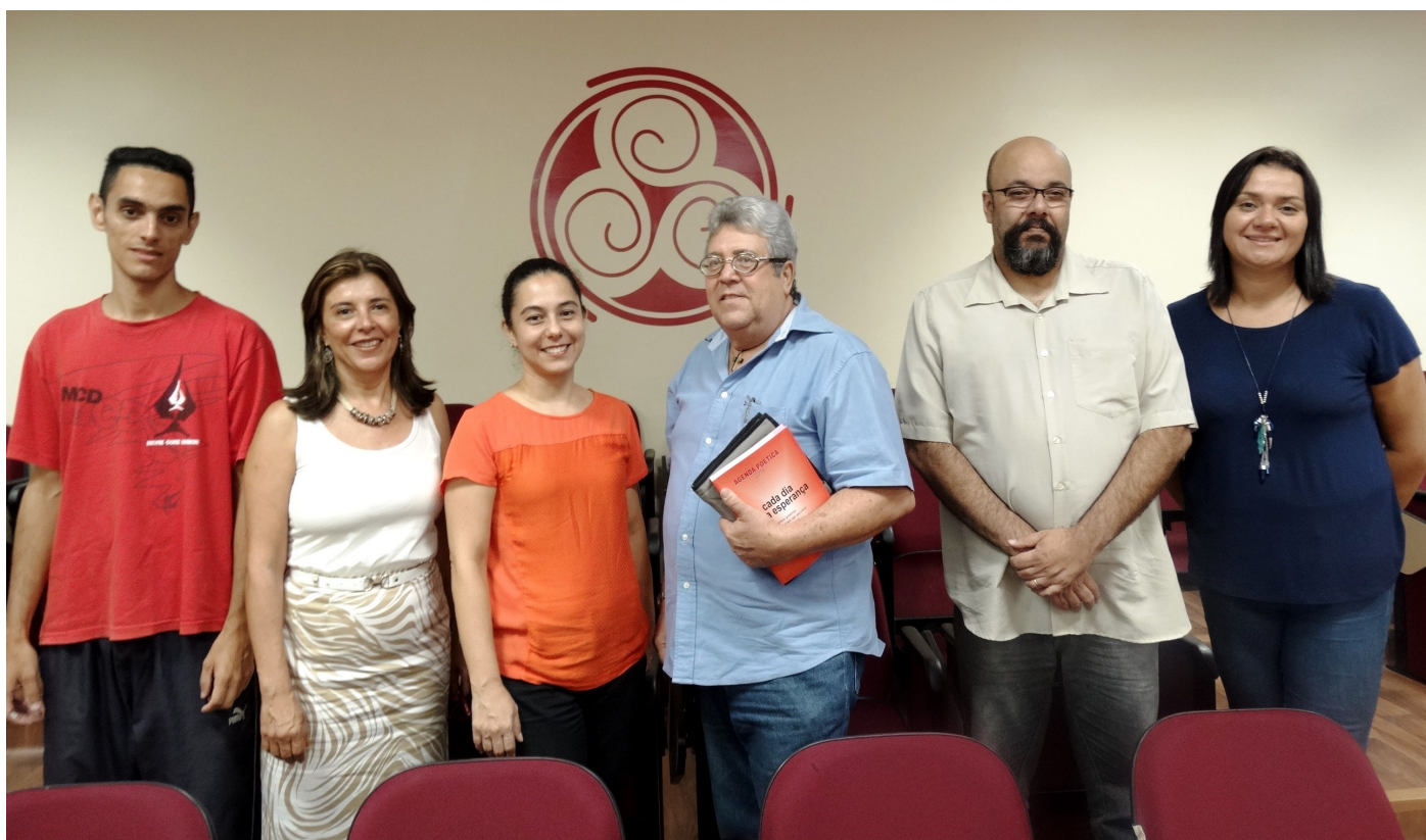
Comissão tem representantes da mantenedora, docentes, funcionários, alunos e sociedade civil

A comissão reuniu-se diversas vezes no decorrer de 2015, preparou, aplicou os questionários, e debateu para análise e validação das informações, num processo participativo, até a redação final do relatório, que apresenta os projetos e as ações desenvolvidas para que a Piaget fique cada vez melhor para todos!